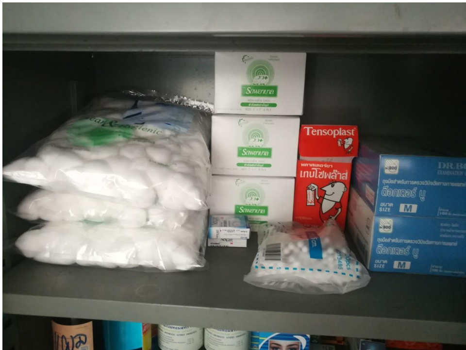
ยาและเวชภัณฑ์เพื่อให้บริการแก่นักเรียน ครูและบุคลากรทางการศึกษา