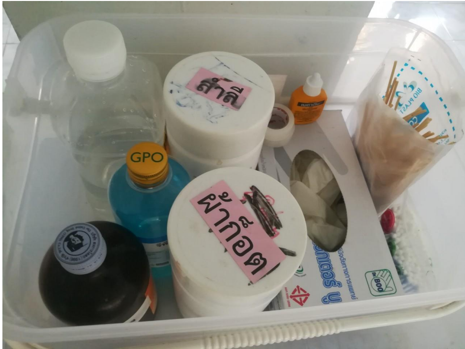
อุปกรณ์ล้างแผล