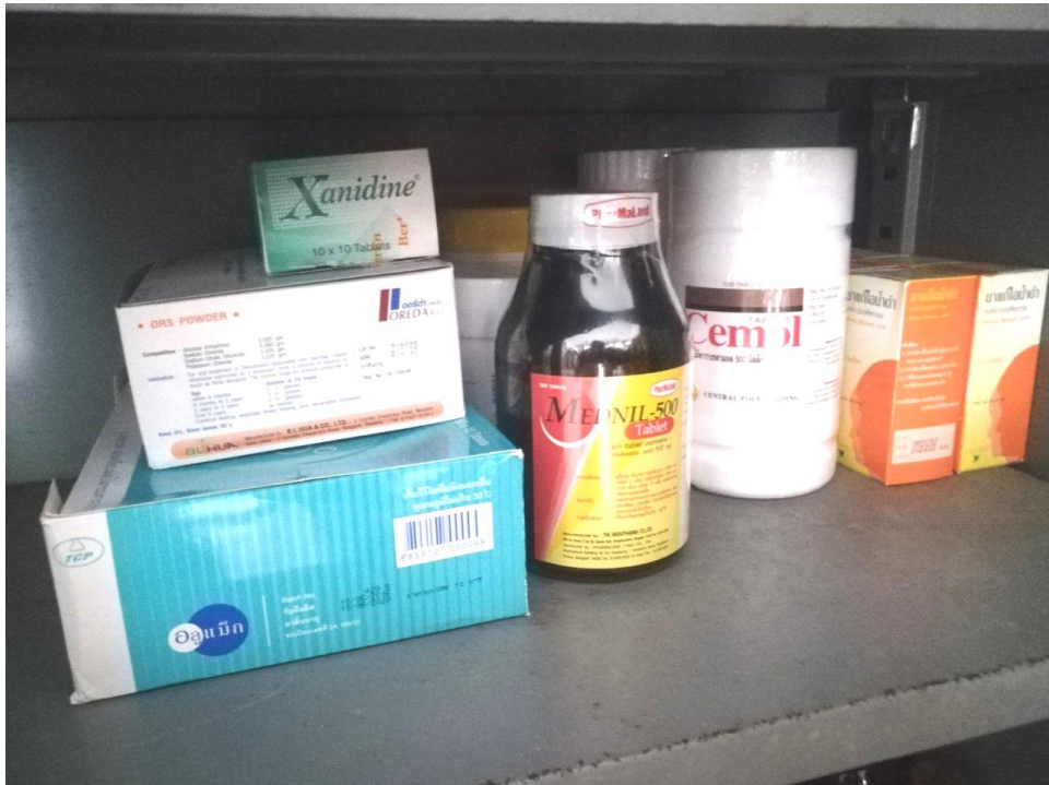
ยาและเวชภัณฑ์เพื่อให้บริการแก่นักเรียน ครูและบุคลากรทางการศึกษา