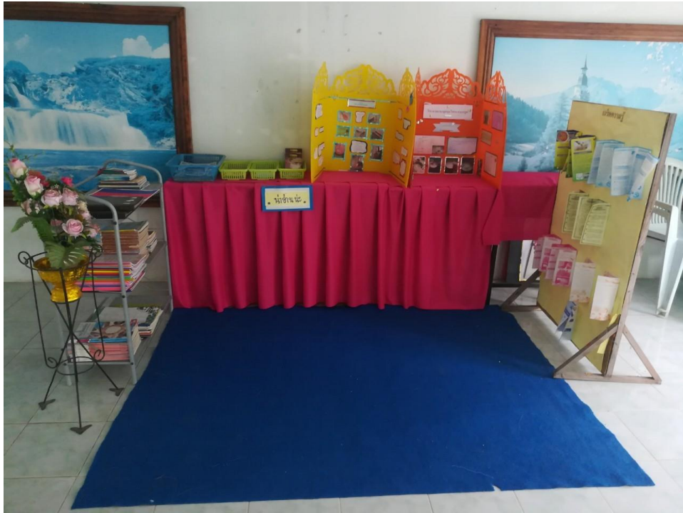
มีมมน่าอ่าน เพื่อให้นักเรียนได้ศึกษาเกี่ยวกับเรื่องสุขภาพ อนามัย