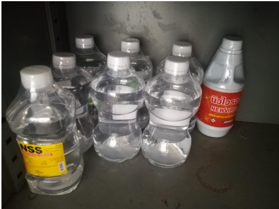
ยาและเวชภัณฑ์เพื่อให้บริการแก่นักเรียน ครูและบุคลากรทางการศึกษา