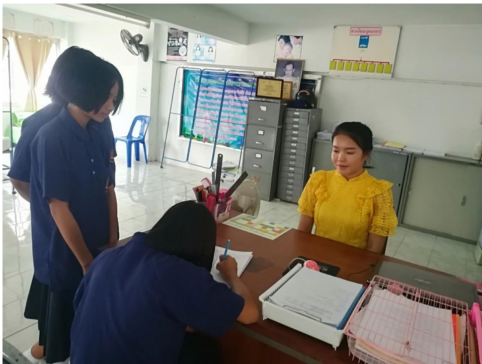
นักเรียนลงทะเบียนการเข้าใช้บริการห้องพยาบาล