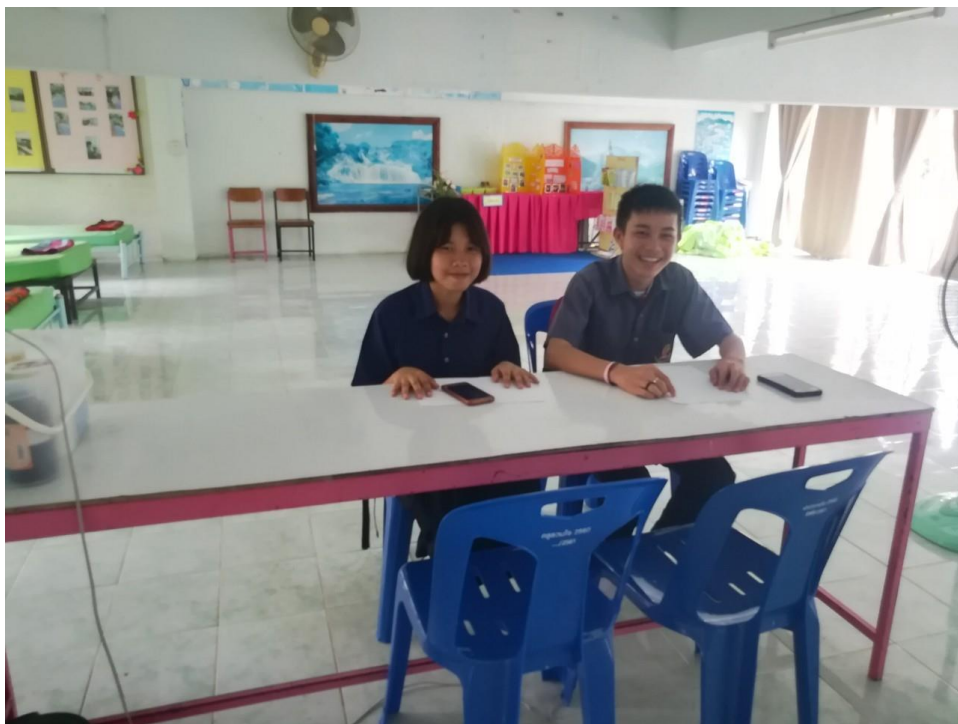
มี สมาชิกชุมชน ออย. น้อย เป็นผู้ช่วยในการดูแลและให้บริการห้องพยาบาล