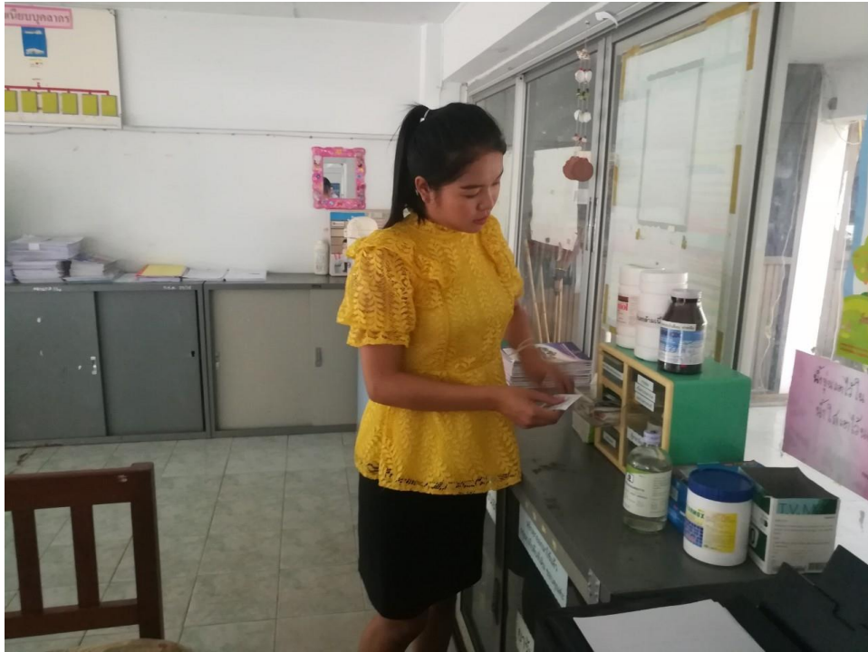
จ่ายยาตามอาการเบื้องต้น