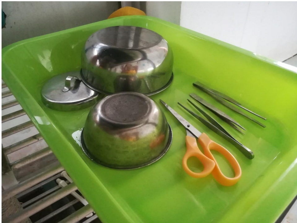
เครื่องมือในการปฐมพยาบาล