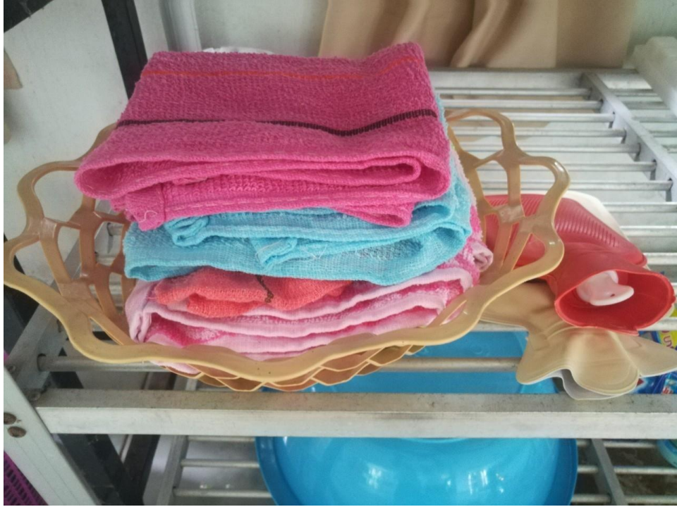
ผ้าขนหนูสำหรับเช็ดตัว และถุงประคบร้อน